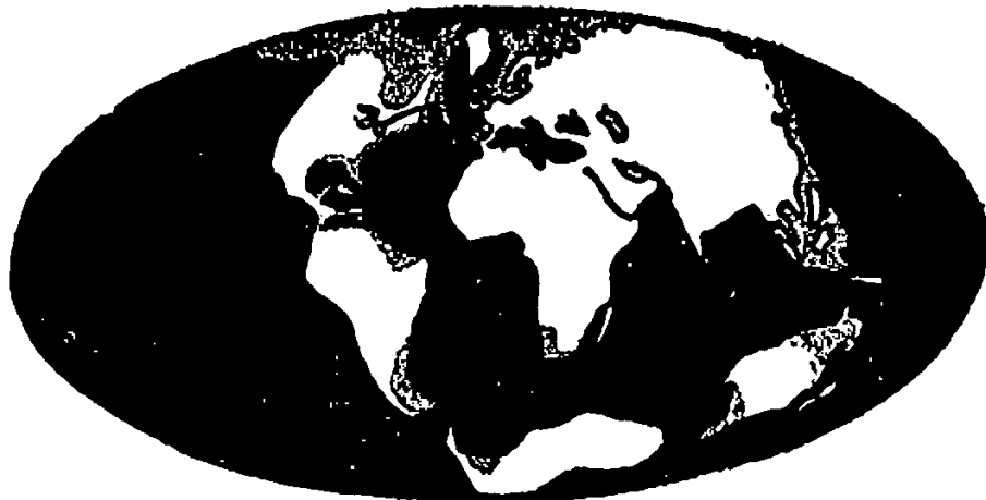
الشكل الثالث : يبين حالة الأرض بعد أن استقر أمرها ، قبل مليون سنة