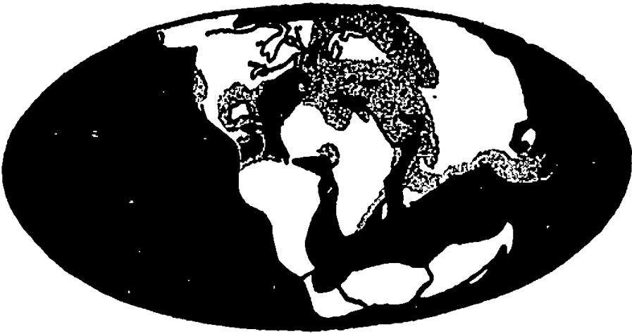
الشكل الثاني : يبين حالة الأرض أثناء عملية انتشار وتباعد قاراتها وقد بدأت هذه العملية قبل خمسين مليون سنة