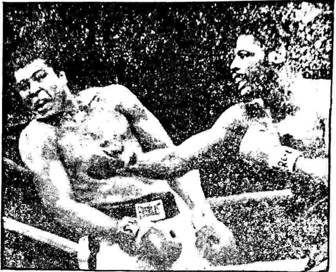
Leon Spinks catches Muhammad Ali with a right hook in their world heavyweight title bout at the Flamingo Las Vegas on Wednesday. The 24-year-old Spinks became the new world champion in a 15-round points decision.